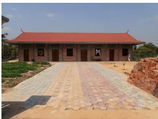
Obrázek 1 a 2: JHP Škola po dostavbě v roce 2012 a ještě chybějící školní jídelna