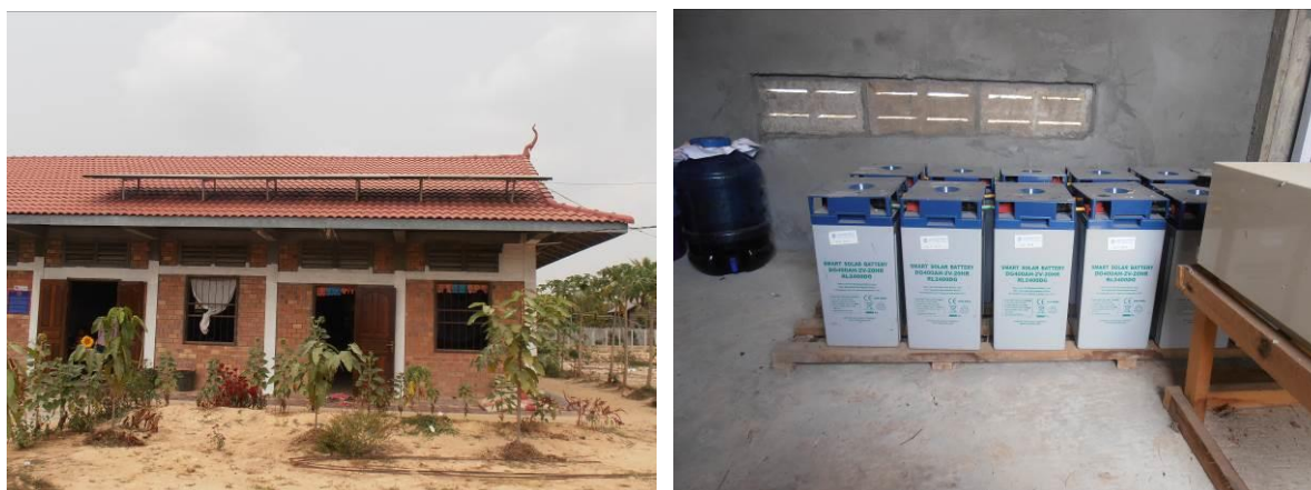
Obrázek 3 a 4: Instalované fotovoltaické panely na budově školy a bateriovna

Instalace fotovoltaického systému si vyžádala novou stavbu, a to vytvoření budovy pro rozvodnu a akumulátorovnu. K začátku listopadu 2013 byl spuštěn zkušební provoz fotovoltaického systému a pak i plný provoz, který víceméně bezchybně funguje do současnosti (květen 2015). [10]