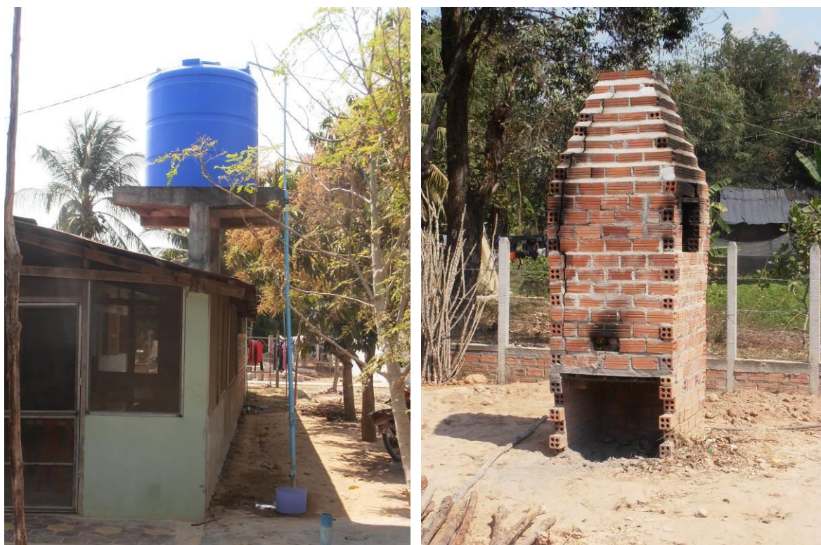
Obrázek 5 a 6: Zařízení na čištění pitné vody a zařízení na spalování odpadu