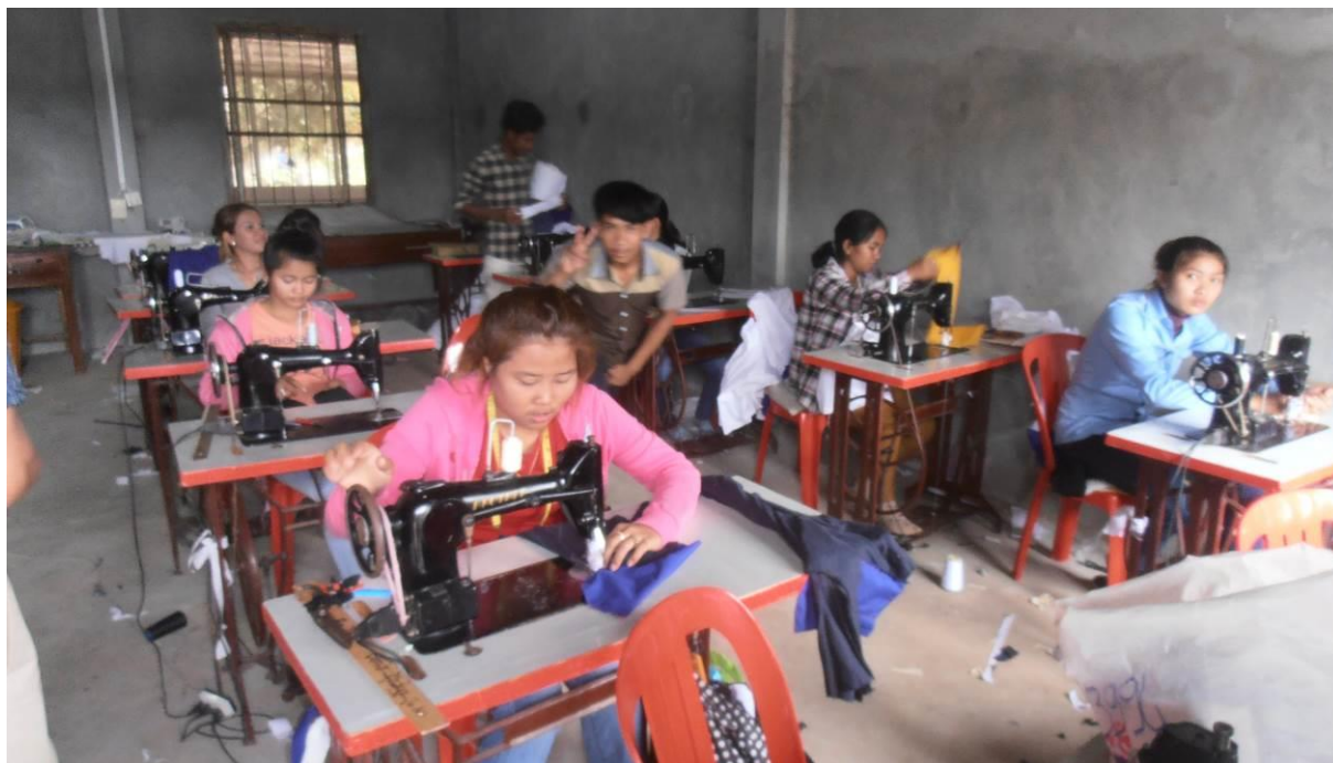
Obrázek 7: Studenti v „šicí třídě“

rozvojové pomoci maximálně efektivní a transparentní a pro donory obecně příznivý. Všem zúčastněným je zřejmé koho podporují vč. možnosti podpory věcnými dary a jaké jsou výsledky a výstupy z této podpory vč. možnosti e-mailové korespondence v angličtině mezi vybranými studenty v závěrečné fázi studia a konkrétními donory v České republice.