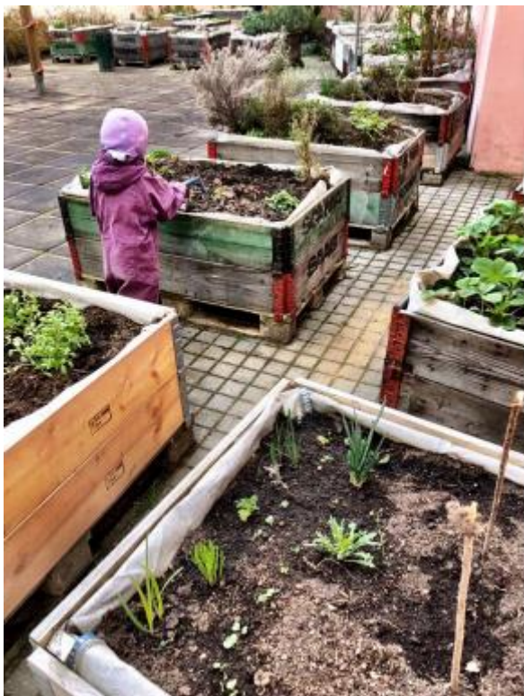
Obrázek 2: Děti na Komunitní zahradě Za Haštalem

Koordinátorem je zaměstnanec Městské části Praha 1, který je ale také zároveň uživatelem této komunitní zahrady. Přestože je starost o komunitní zahradu součástí jeho zaměstnání, z rozhovoru vyplynulo, že mu tato práce přináší velkou radost a uspokojení: „Lidé sem chodí relaxovat a odpočívat, nechodí sem naštvaný. Teď si vemte, já byl fakt unavený, když jsem přišel a jak o tom povídám, úplně zářím, protože toto je fakt jako oáza... Já tady chodím a tolik lidí mě zdraví, to je prostě úžasný, co se tady podařilo, sem chodí ty maminky, co jsou místní. Třeba když zaléváme hadici a byla tady školka, tak jsem vzal tu hadici a ty děti pod tím běhaly. To jsou krásy života“ (koordinátor 1). Aktivitu dětí a rodičů ukazuje obrázek č. 2.