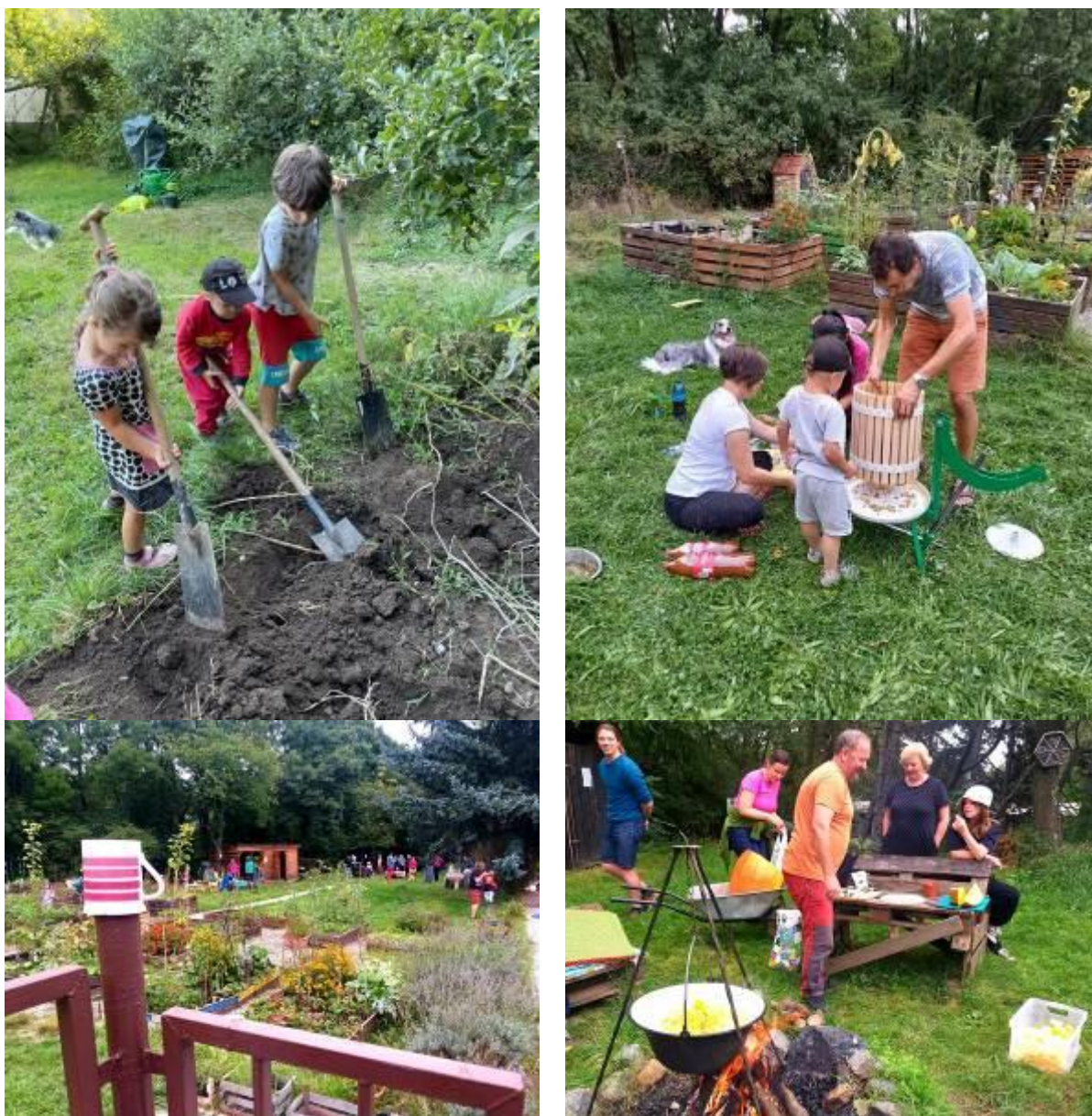
Obrázek 4: Komunitní zahrada Paletka