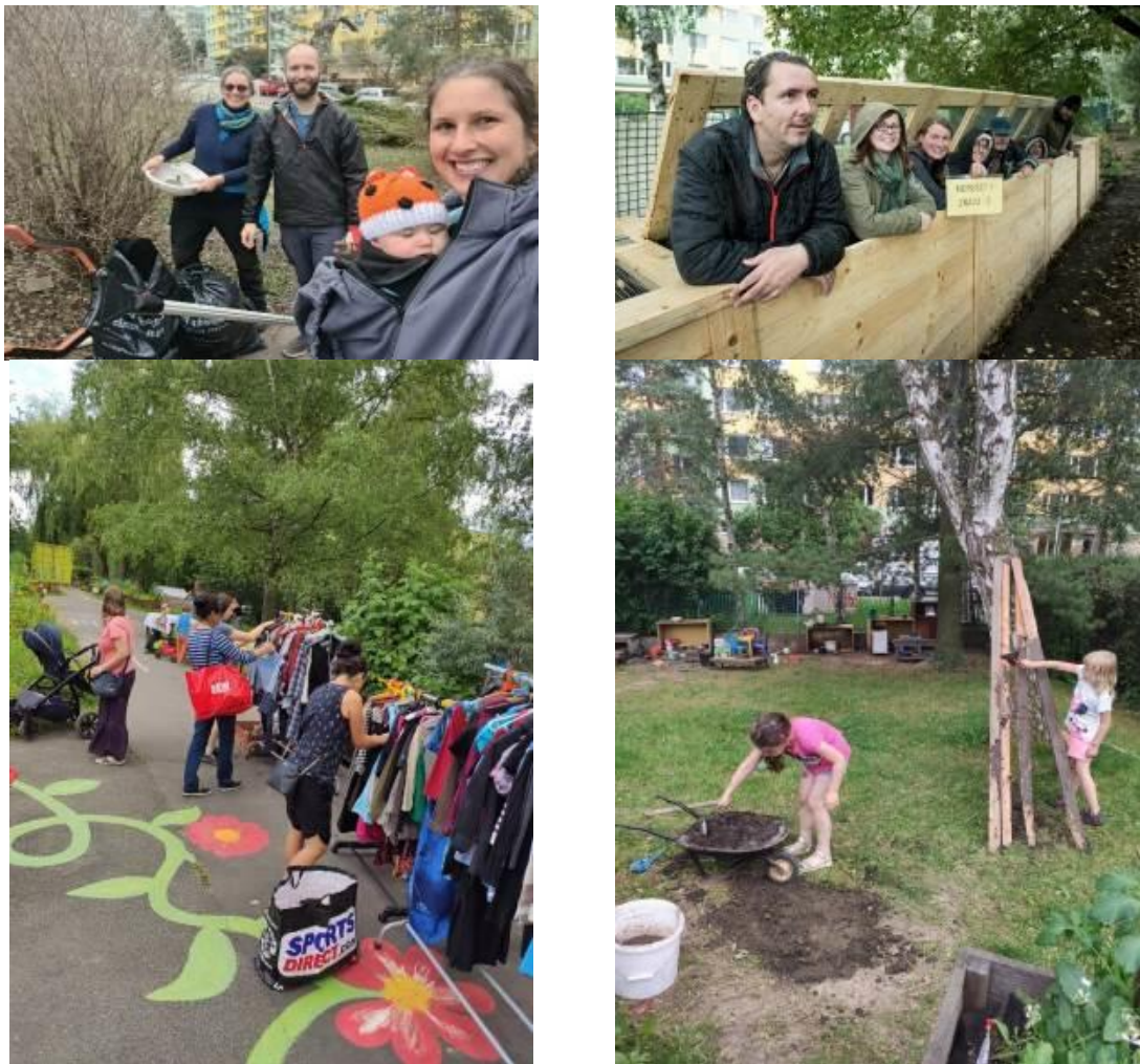
Obrázek 5: Komunitní zahrada Vidimova