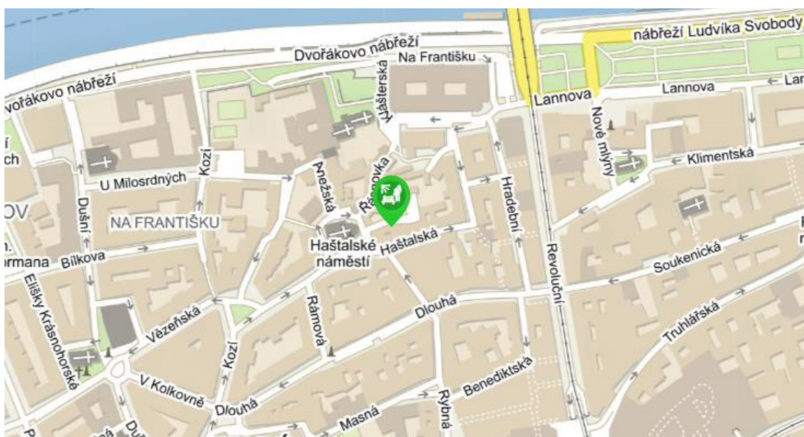
Obrázek 1: Mapa umístění KZ Za Haštalem