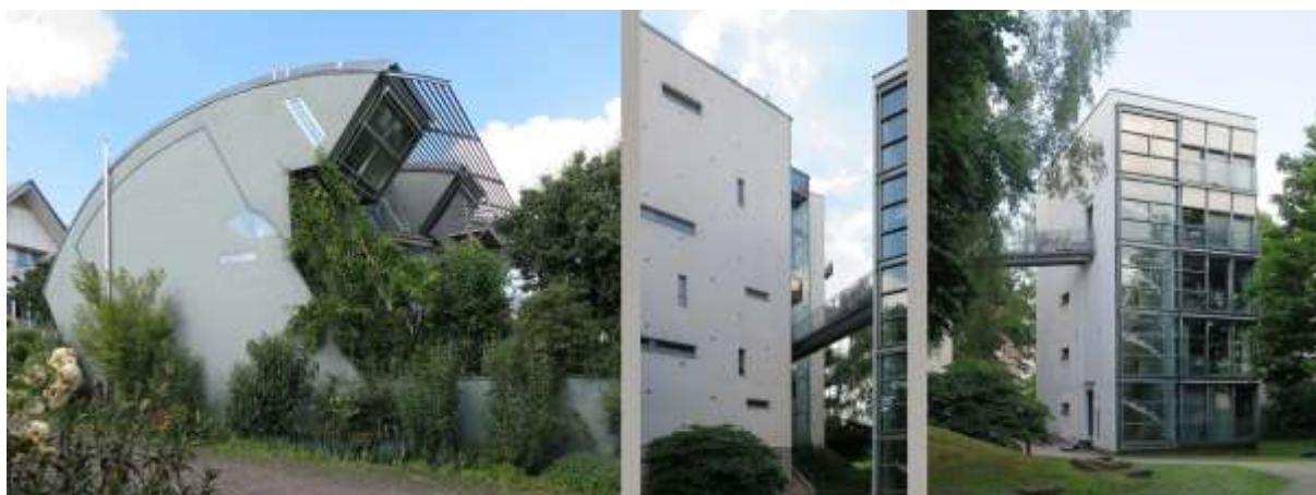
Obrázek 3: Vzorové domy výstavy Wohnen 2000 realizované v rámci IGA 1993, současný stav