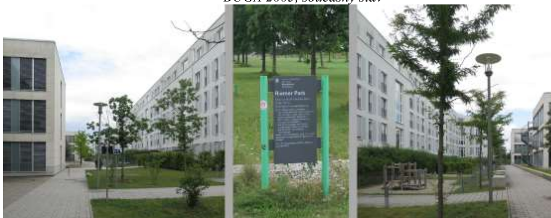
Obrázek 4: Obytný soubor Messestadt Reim v Mnichově plánovaný a budovaný v návaznosti na BUGA 2005, současný stav