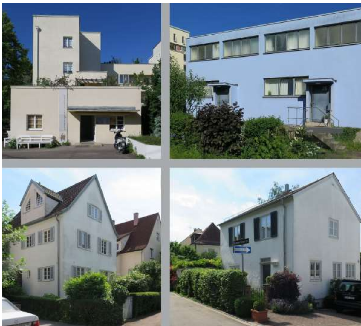
Obrázek 1: Současná podoba vzorových sídlišť Weissenhof a Kochenhof

architekty své doby, kteří byli nejen advokáty nových forem, ale i moderních technologických postupů (Joedicke, 2016). Výsledkem byla přesvědčivá a strhující ukázka kvalit současné architektury, a to navzdory skutečnosti, že finanční dostupnost takto realizovaného bydlení zůstala nenaplněnou ambicí. Odpovědí tradičně smýšlejících architektů se stala „kontravýstava“ Deutsches Holz für Hausbau und Wohnung, na jejíž přípravě se podílela také asociace, zastřešující zájmy zpracovatelů dřeva a podnikatelů v oblasti lesního hospodářství (Deutsche Forstwirtschaft). Domy vzorového sídliště Kochenhof byly stavěné tradičním způsobem, jejich vnitřní dispozice však vesměs reflektovaly moderní životní styl (Fülscher und Philipp, 2017, s. 82-83). Když byla výstava po pěti letech příprav v roce 1933 slavnostně zahájena, nezdráhal se ji k upevnění svého postavení propagandisticky využít nacistický režim. Právě svým intenzivně deklarovaným příklonem k tradiční a historizující architektuře však nacizmus tyto formy na dlouhou dobu diskreditoval a ještě dlouhá desetiletí po druhé světové válce tak byl v Německu za jediný správný styl v architektuře považovaný mezinárodní styl, vycházející z meziválečného funkcionalismu (Fischer, 2016, s. 264-265).