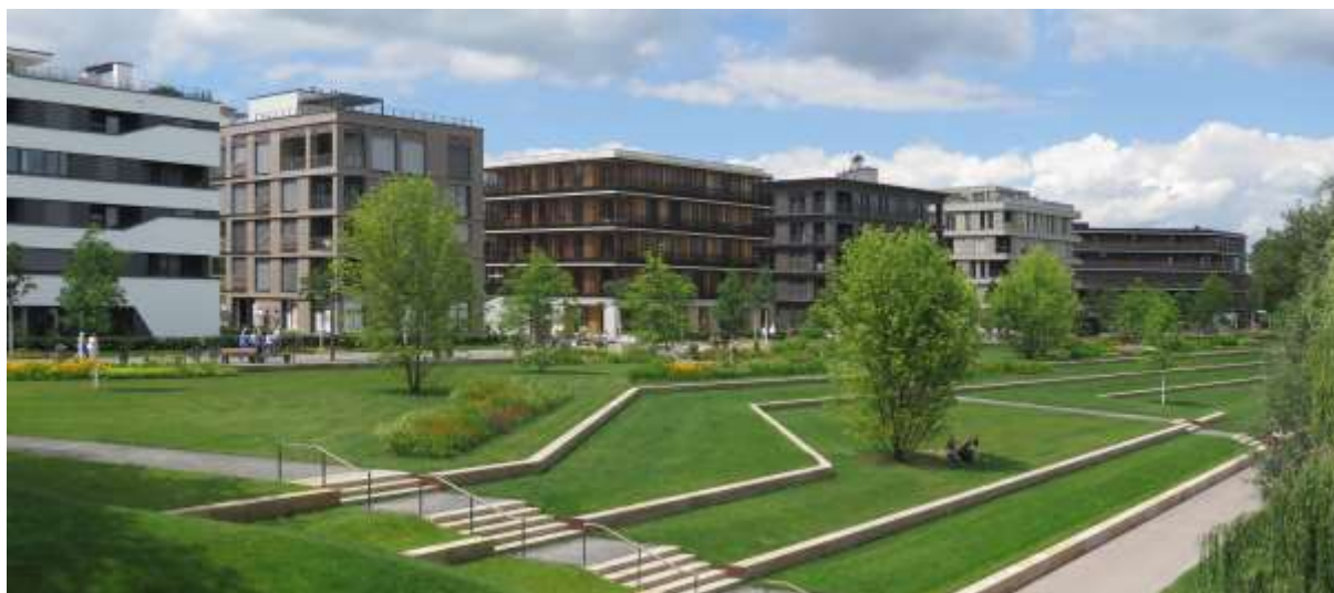
Obrázek 5: Bloky vzorových obytných domů při výstavě BUGA Heilbronn 2019